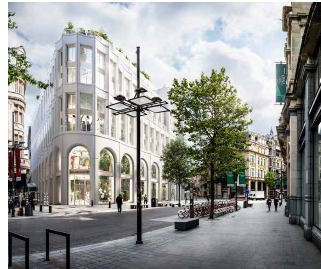
KDG Meir Antwerpen. (Architectenteam: Binst Architects + B architecten)

Door de state of the art technieken en het hoogstaand vakmanschap is deze futuristische realisatie klaar voor de volgende generatie. >