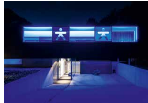
Lofthouse Luc Binst.

Inmiddels zijn we 2021 en staat Luc aan het hoofd van een zestigkoppig multidisciplinair bureau. Binst Architects huist aan de Luikstraat in Antwerpen. Binst' eigen creatief nest