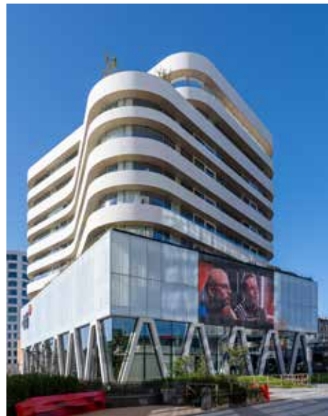
Niet enkel het videoscherm trekt de aandacht, ook de vloeiende penseeltrek waarmee Binst deze stek van DPG Media op het canvas van de hemel heeft aangebracht. Architectuur als hefboom voor dynamisch ondernemerschap.

Architectuur van Binst getuigt van een iconische eigenheid, zet aan tot een intense beleving van de wereld en zorgt voor een positieve noot.