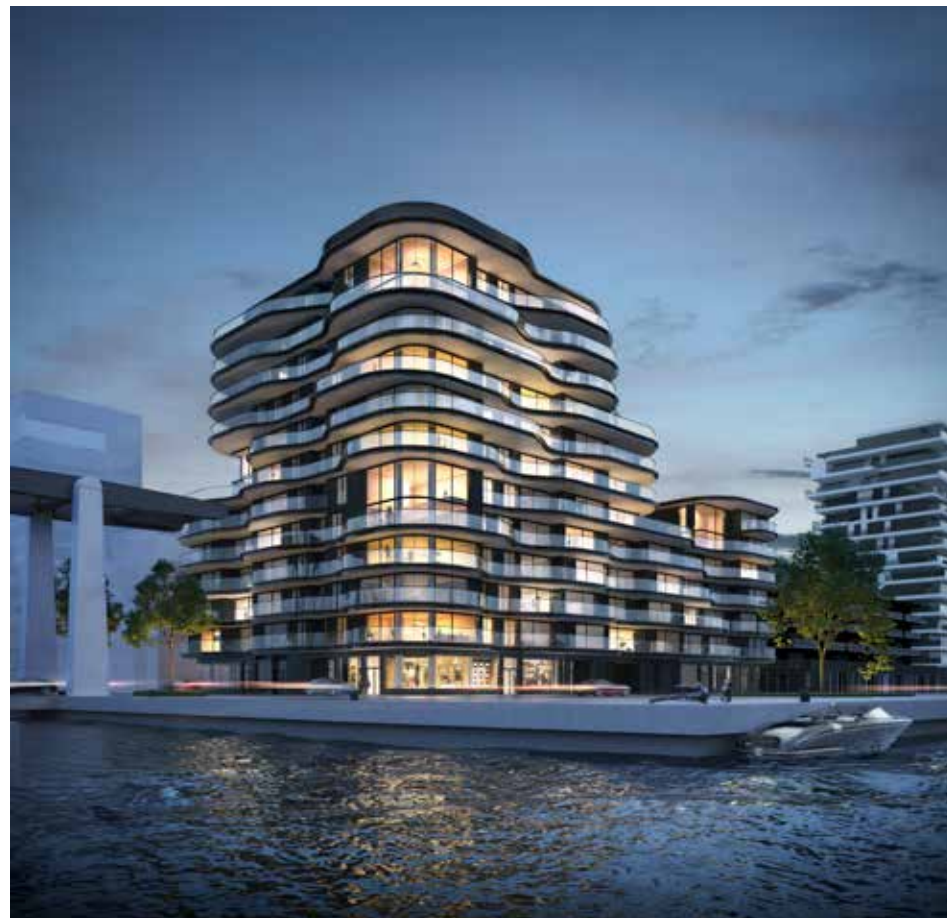
One Baelskaai Oostende. Realisaties van Binst gaan in dialoog met de omgeving en bieden de bewoners de luxe om kwaliteitsvol te genieten.

Uiteindelijk zal de vrijstaande woning met praktijkruimte van Binst himself nog tien jaar lang internationaal nazinderen met meer dan 230 publicaties wereldwijd en tal van prijzen. Luc kreeg er op 23 november 2006 zelfs de Lensvelt Architect Interieurprijs voor. Tot op vandaag is hij de enige Belgische ontwerper die die eer te beurt is gevallen. Het leverde, geheel terzijde, zo'n 12.500 euro op.