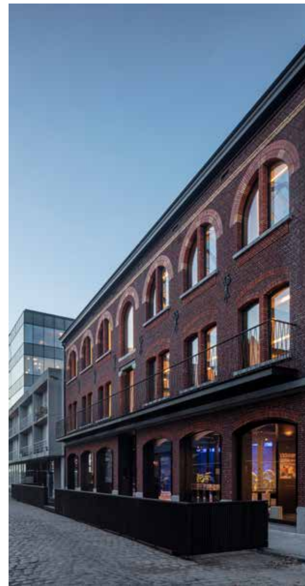
Gevel kantoren Binst Architects