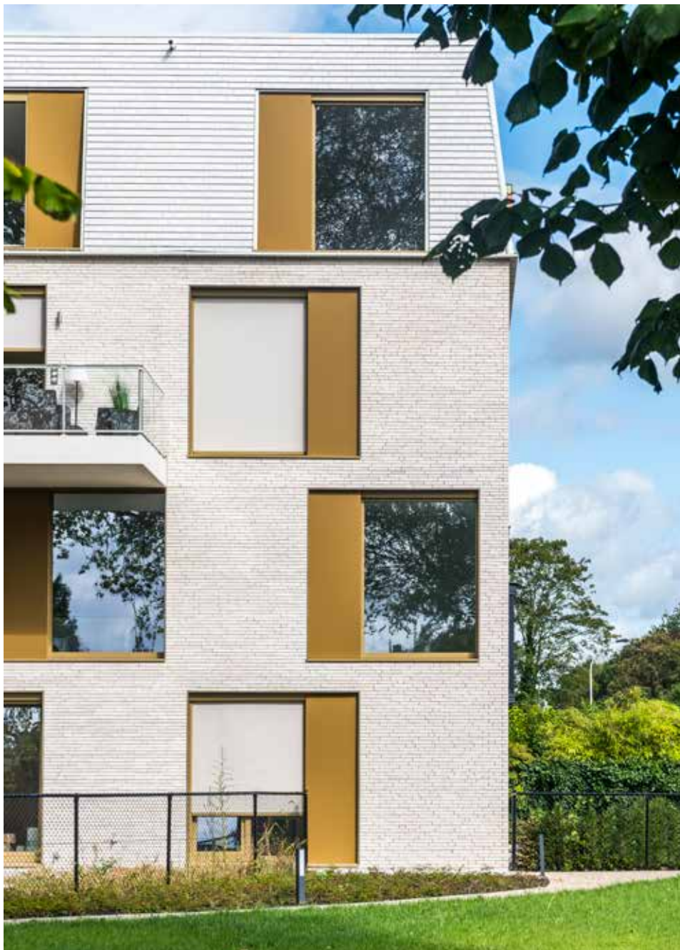
Gevel: Terca Elignia Arctica Wit. Dak: Koramic Tegelpan 301 Beige-wit geglazuurd (product op maat)