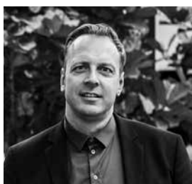
Binst Architects, Luc Binst, Antwerpen

Dit project omvatte de restauratie en herbestemming van het neorenaissance kasteel 'het Hooghuis' in Ekeren en de inplanting van twee nieuwbouvvolumes op dezelfde site. Binst Architects stond hierbij in voor het ontwerp, de vergunningen en de aanbesteding en het project werd verder opgevolgd door Architectenassociatie Angst & D'hoore.